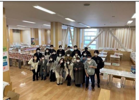
終了後のミーティングと記念撮影