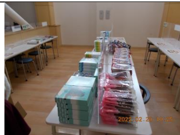
羽幌コーナー全景