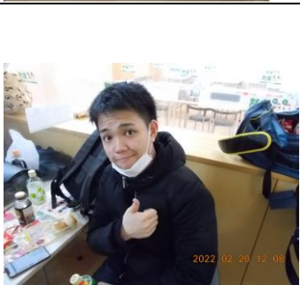
食糧支援実施中の風景 (受付する自治会部員と並ぶ学生)