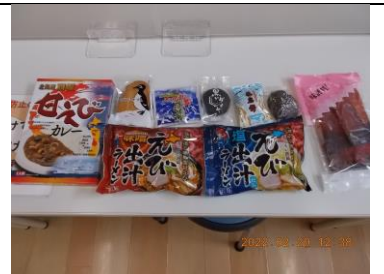
羽幌からの商品全種類