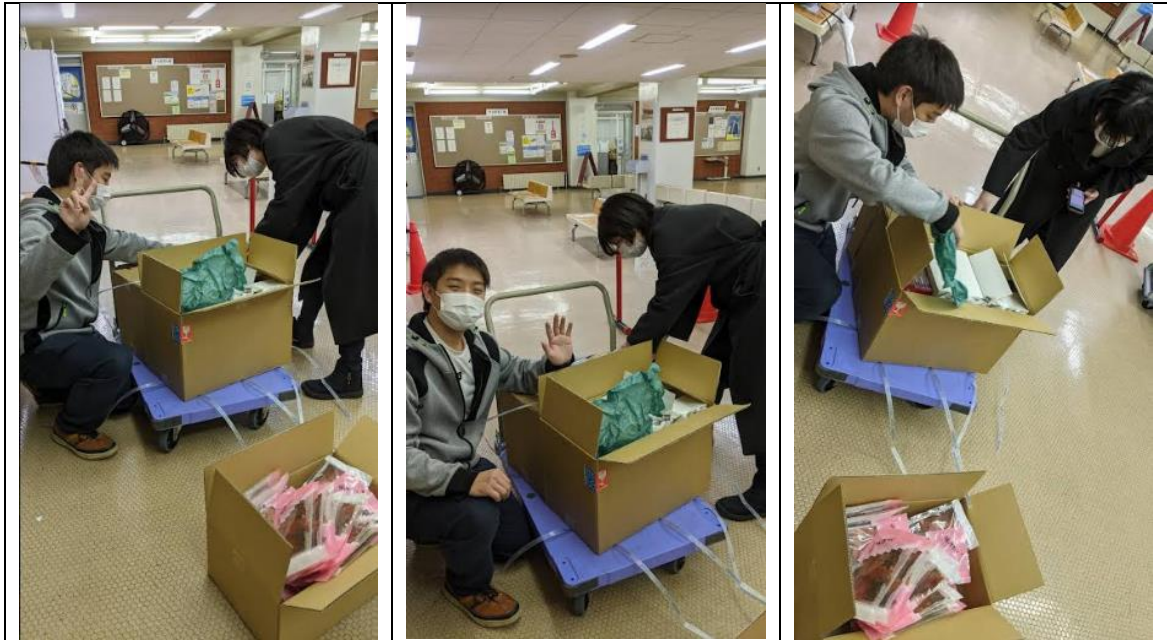
Ⅱ部自治会の部長さんと一緒に作業