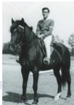
牧場経営を夢見ていた頃の学生時代