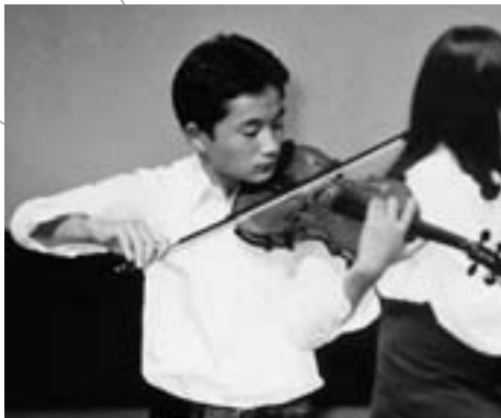
▲中学時代、地元の音楽コンクール出場の時の1コマ