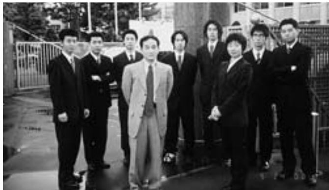
▲昨年度ゼミ卒業生との集合写真(中央が私)

たが、その中でも少し変わったアルバイトで、セミプロのオーケストラに入っていました。入団オーディションにたまたま受かりまして、周りのオーケストラのメンバーは音大出身者ばかりでしたが、また別の世界が垣間見られたという点では貴重な体験だったと思います。札幌に来て5年目ですが、まだオーケストラの活動も始めておらず、そろそろ再開したいと考えている今日この頃です。