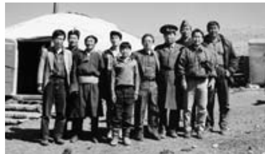
▲モンゴルでのバオ生活

れに3分の1が勉強という感じだった。そういう社会活動とか、ボランティア活動というのはやっぱり自分にとって、いろいろな視野を広げる意味で役立ったと思っているし、だから「何だっていいから、やっぱりみんなと一緒に活動しながら、多少ともこの世の中が明るくなるような方向を見つけていけるのであれば、それをやってくれ」ということを私は必ず言うようにしている。それから、求人で見えた会社の責任者とお会いした時も、みんなと仲良く明るくやれない学生は敬遠すると。で、どうしたら仲良くやれるかというと、やはりそういう経験がないと、と言う。