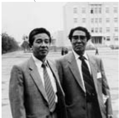
▲ユジノサハリンスクにて

1938年9月20日—札幌市に生まれる 1966年—北海道大学大学院農学研究科農業経済学 専攻修士課程修了 1969年—北海道大学大学院農学研究科農業経済学 専攻博士課程単位取得退学 1970年—北海道立総合経済研究所水産経済課 研究員就任